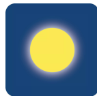
Ámbar en modo ON

Gracias a un recubrimiento absorbente de vanguardia que evita interferencias