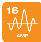
Anschluss an jede 16A (3-Phasen)-Ladestation oder -Station mit einem Typ-2-Anschluss.

Laden Sie zuhause oder unterwegs Typ 2 zu Typ 27 PIN | 3PHASE